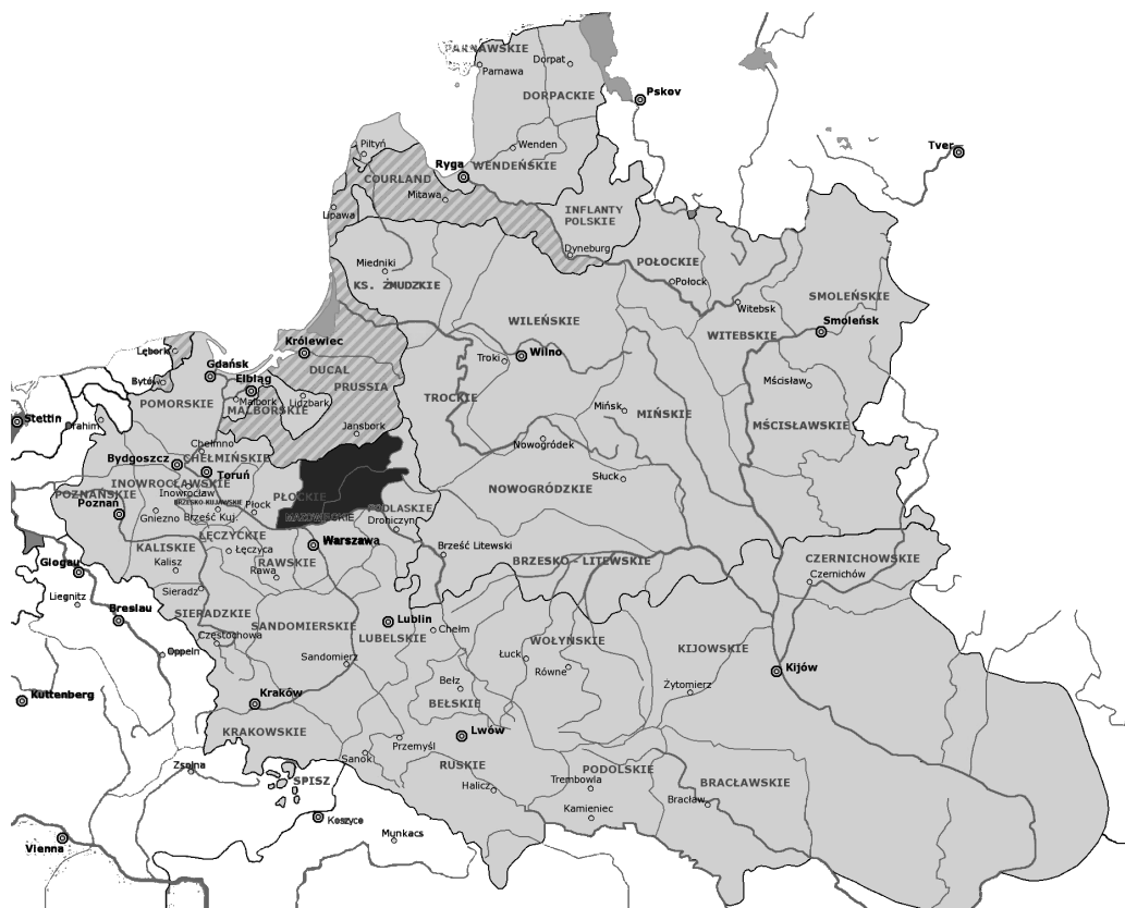
Ilustracja 1: Rzeczpospolita w okresie największego zasięgu terytorialnego, źródło: Wikipedia, Wolna Encyklopedia. Na czarno zaznaczono obszar, którego dotyczy niniejszy tom